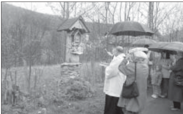
Więcej zdjęć z poświęcenia kapliczki można obejrzeć w internecie: www.gorzyniec.xt.pl .