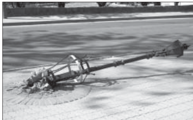
Wandale przewrócili m.in. lampę w centrum miasta.

Aby się bronić przed wandalami, złodziejami i wszystkimi, którzy za nic mają wspólne miasto władze miasta zamierzają zlecić