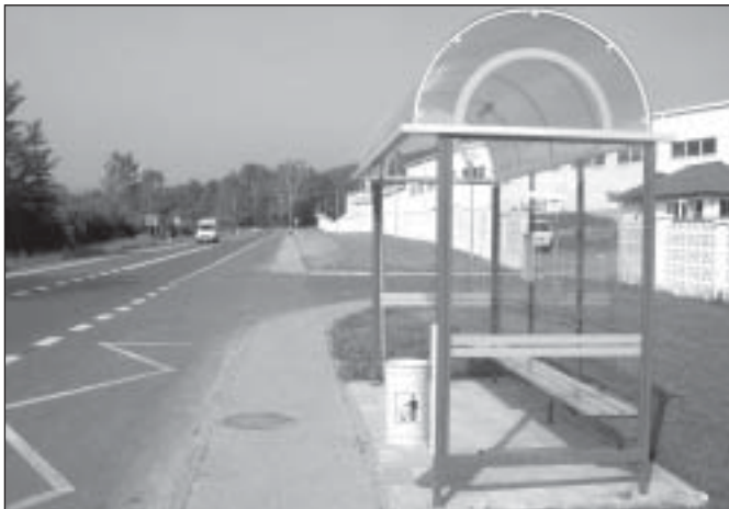
Mieszkańcy Piastowa cieszą się z nowej wiaty, której wcześniej tu nie było

Zakład Usług Komunalnych od 30 maja 2008 r. wzbogacił się o nowy sprzęt. Dzięki dotacji z Urzędu Miasta zakupiono w drodze przetargu ciągnik PRONAR 1025A2.