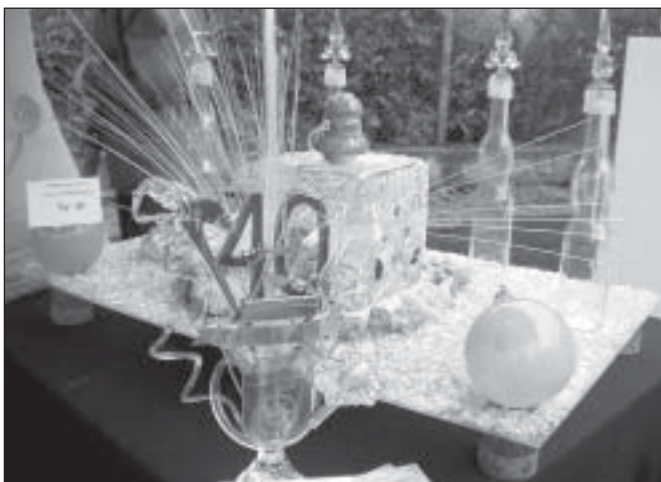
Ze szkła można zrobić bardzo ciekawe rzeczy, jak te prezentowane w ubiegłym roku podczas obchodów 40-lecia Piechowic.

Zgłoszenia można dokonać do 15 czerwca na adres organizatora: Piechowicki Ośrodek Kultury, 58-573 Piechowice, ul. Żymierskiego 53, e-mail: informacja@piechowice.pl , tel. 075/ 76 17 201