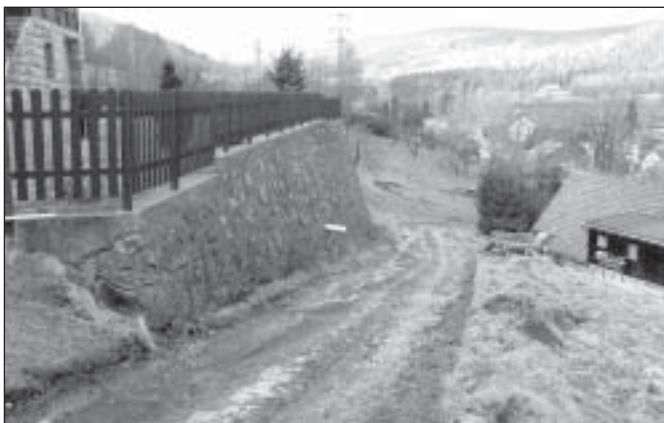
Ulica Wczasowa będzie wkrótce jak nowa