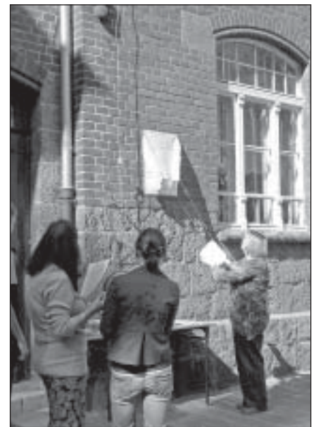
Uroczystość odsłonięcia tablicy pamiątkowej.

z dużym zaangażowaniem wykonywali wszystkie niezapominajkowe zadania, dzięki temu mogli uświadomić sobie konieczność i potrzebę ochrony środowiska, poczuć odpowiedzialność za jego stan w naszej gminie, wzrosła też ich wrażliwość na piękno przyrody naszego regionu.