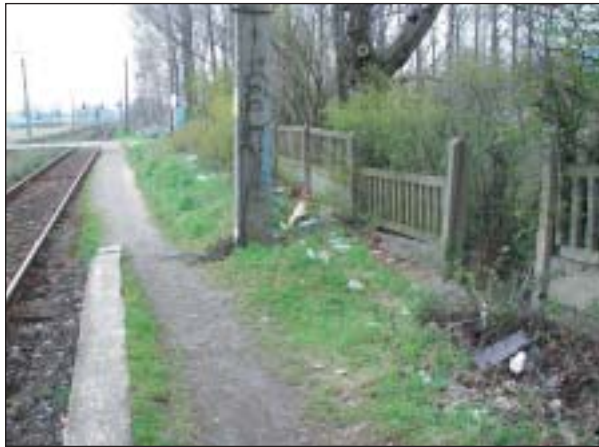
PKP nie ma pieniędzy na odnowienie dworca

dworcem i perony. W maju uprzątnięte zostało również dzikie wysypisko śmieci, jakie powstało przed dworcem. PKP uczyniło to jednak dopiero po interwencji Urzędu Miasta.